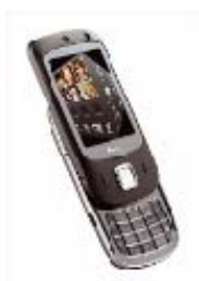
HTC Touch Dual

Design, multimédia, écran tactile... chaque client peut trouver le terminal répondant à ses attentes :